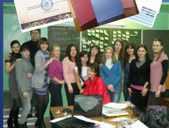
Ярославский государственный технический университет